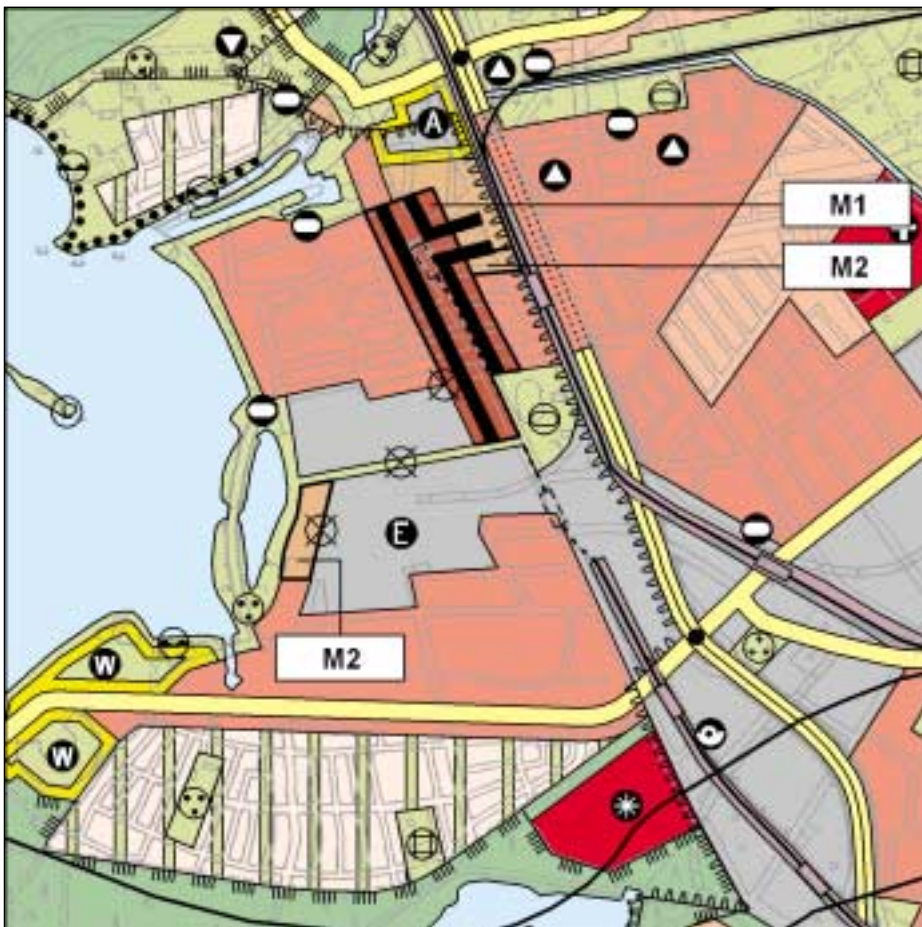
FNP Änderung (wirksam mit Bekanntmachung im Amtsblatt) 1:25.000

Die Darstellung des FNP wird für den Bereich am Borsig-Hafen den weiterentwickelten Nutzungsvorstellungen angepaßt. Gleichzeitig wird der Zentrumsbereich Tegel entsprechend der inzwischen vollzogenen Entwicklung zum Hauptzentrum als gemischte Baufläche M1 dargestellt.