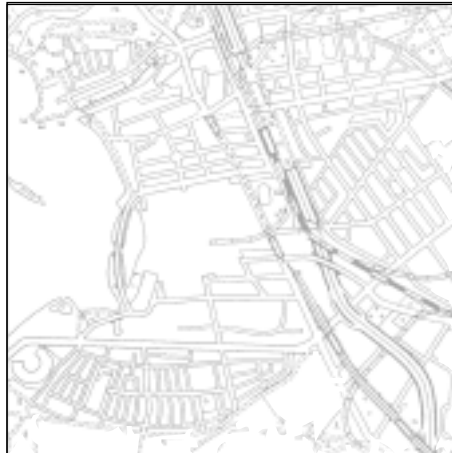
Topographische Karte 1:50.000