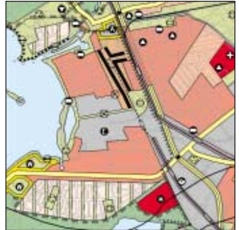
FNP Berlin (Stand Juni 2000) 1:50.000