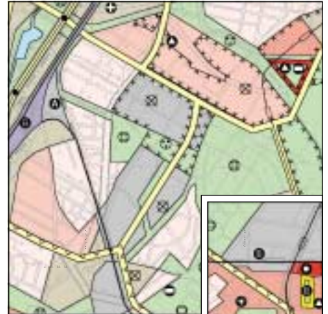
FNP Berlin (Stand Juni 1999) 1:50.000