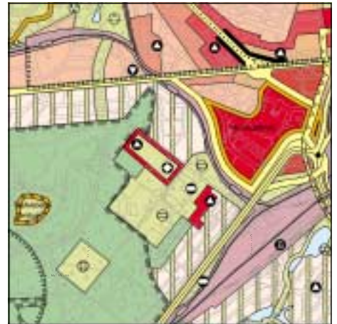
FNP Berlin (Stand Okt. 2000) 1:50.000