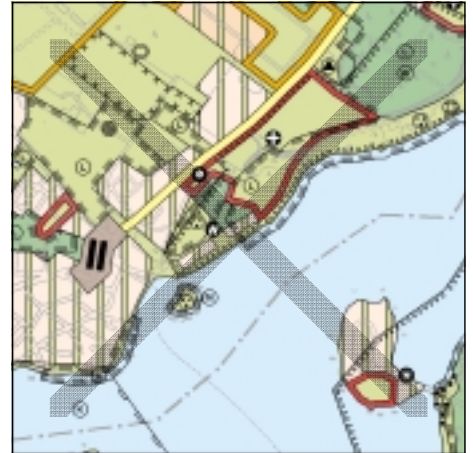
FNP Berlin (Stand Juli 2001) 1:50.000