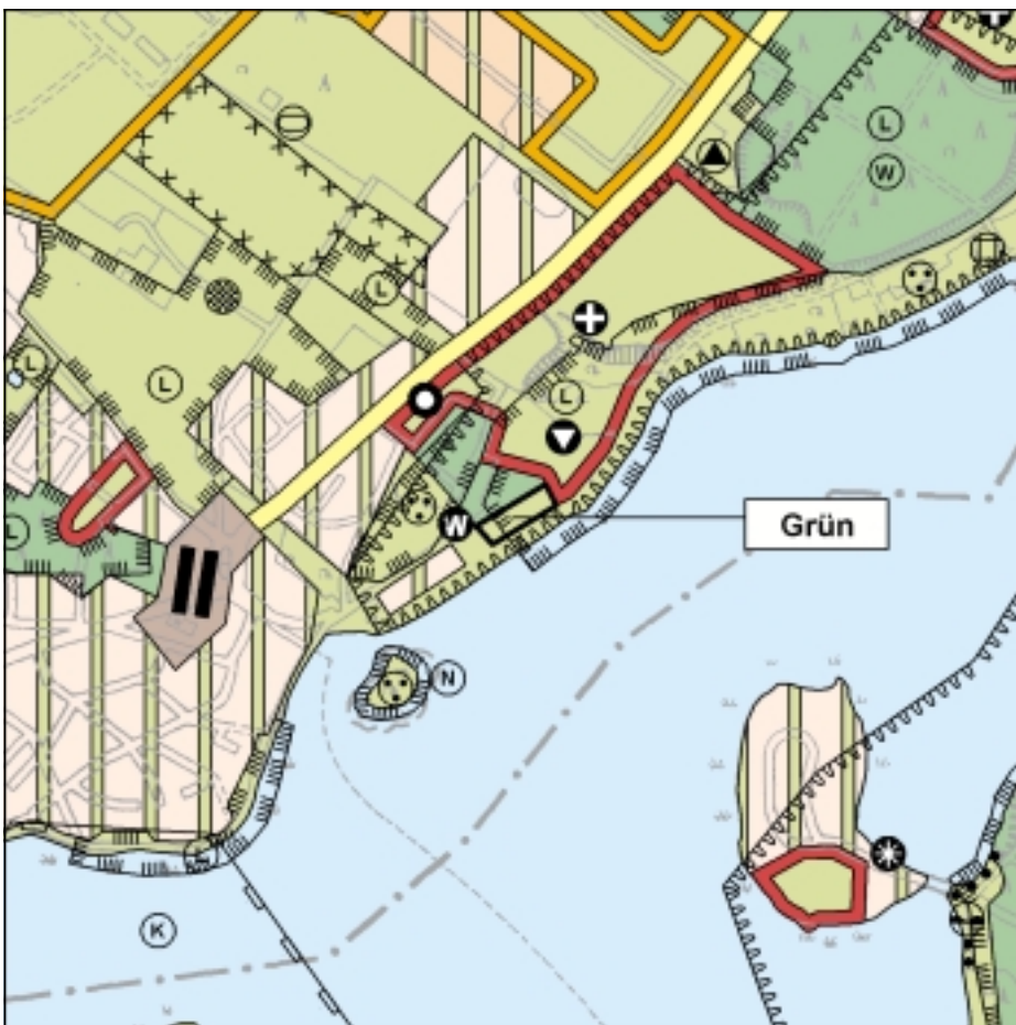
FNP Änderung (wirksam mit Bekanntmachung im Amtsblatt) 1:25.000

Ziel der Änderung des Flächennutzungsplans ist die Schaffung planungsrechtlicher Voraussetzungen für den Erhalt und die behutsame Entwicklung des Gutsparks unter Berücksichtigung der landschaftsplanerischen und denkmalpflegerischen Belange.