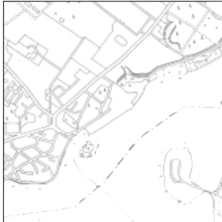
Topographische Karte 1:50.000