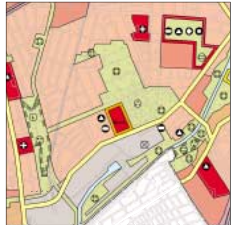
FNP Berlin (Stand Okt. 2000) 1:50.000