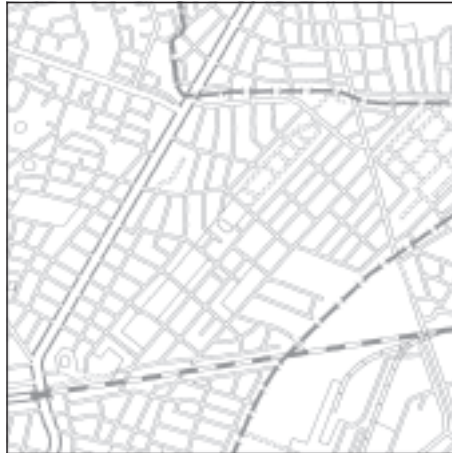
Topographische Karte 1:50.000