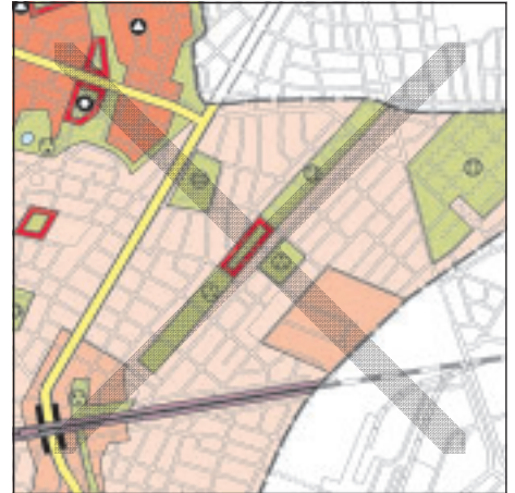
FNP Berlin (Stand März 2002) 1:50.000