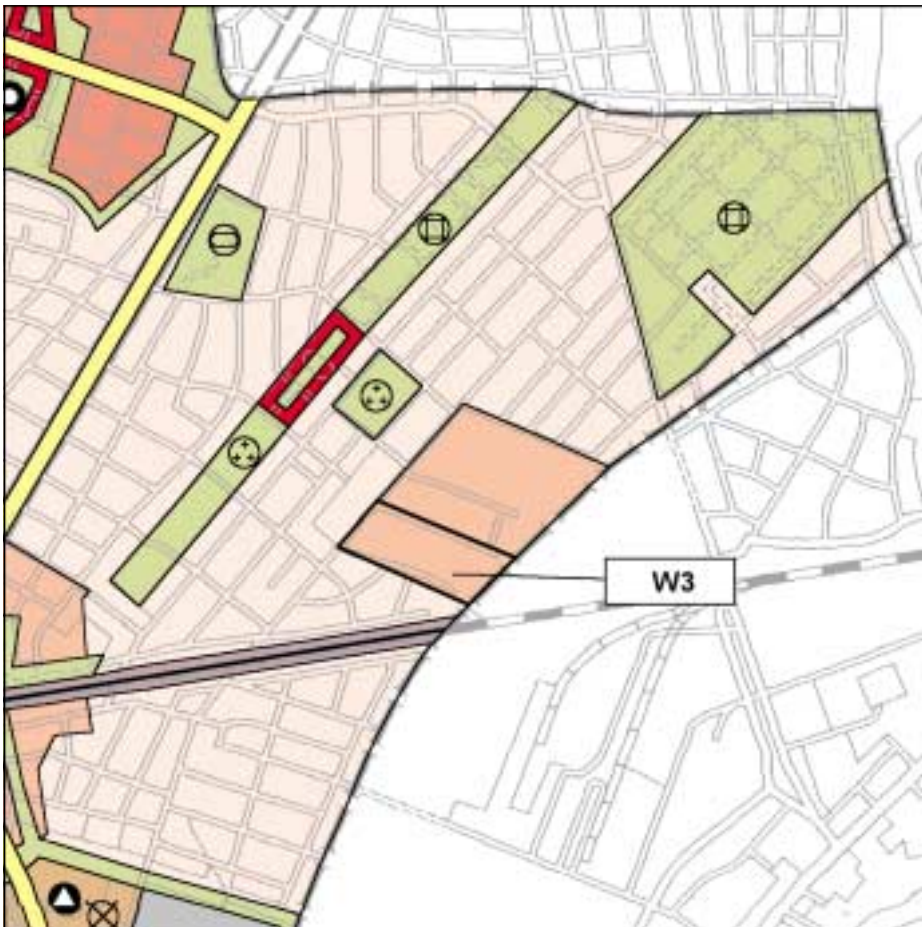
FNP-Änderung (wirksam mit Bekanntmachung im Amtsblatt) 1:25.000

Die Darstellungen des FNP werden den weiterentwickelten Nutzungsvorstellungen angepasst: