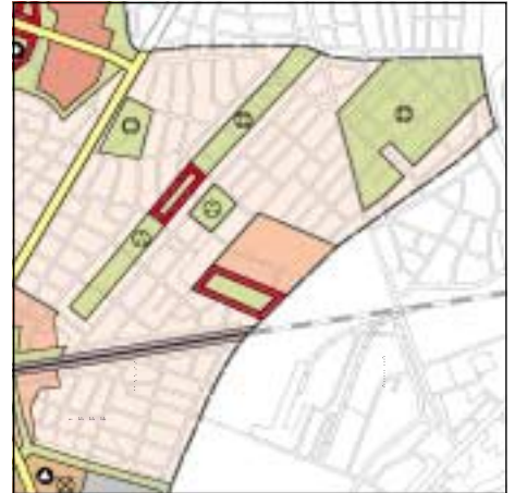
FNP Berlin (Stand Okt. 1998) 1:50.000