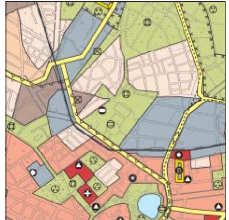
FNP Berlin (Stand Januar 2004) 1:50.000