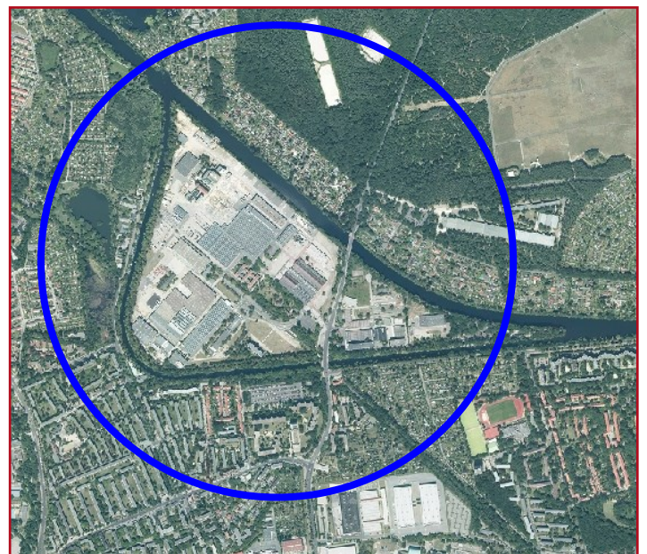
Luftbild Gartenfeld, Berlin-Spandau