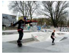
Neuanlage Skaterpark, Märkisches Viertel

In Berlin wird das Programm von der EU kofinanziert und in Partnerschaft mit der Senatsverwaltung für Stadtentwicklung und Wohnen, den Bezirksamtern und Wohnungsunternehmen, der Bewohnerschaft und den Gewerbetreibenden umgesetzt. Wesentlich für die Planung und bedarfsgerechte Umsetzung ist die Mitwirkung der Bevölkerung.