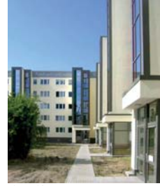
Private Sanierung WBG Wilhelmsruh eG