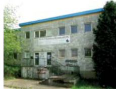
© Foto: Pankow Kita in der Karower Chaussee vor und nach der Sanierung