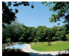
Neugestaltung Quartierspark, Friedrichsfelde

In Berlin werden über das Programm Stadtumbau insgesamt 16 Gebiete gefördert (Stand Dezember 2016). Anfangs spielten auch in Berlin der Rückbau und die Nachnutzung von leerstehenden Einrichtungen wie Kitas und Schulen eine große Rolle. Heute steht der Stadtumbau vor allem unter dem Vorzeichen der wachsenden Stadt.