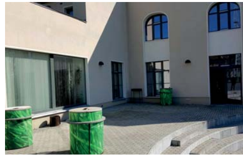
Außenbühne der Jugendfreizeiteinrichtung