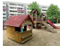
Spielplatz Walter-Friedrich-Straße