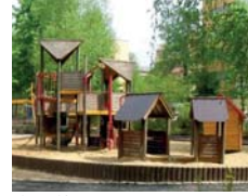
Spielplatz Walter-Friedrich-Straße nach der Sanierung

Bucher Bürgerhaus bis zur Spielplatzsanierung. Zusätzlich wurden nach einer Gebäudesanierung auch die Freiflächen neu gestaltet. Eine Auswahl an bereits umgesetzten Projekten wird im Folgenden kurz vorgestellt. Die Projekte sind mit roten Nummern im Luftbild verortet.