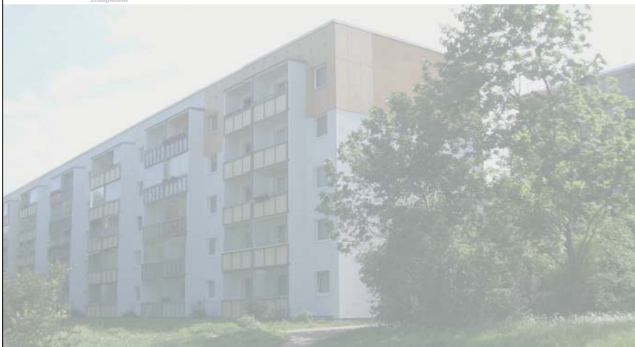
Sanierter Wohnungsbau, Karower Chaussee