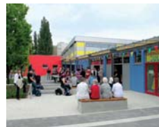
Umbau zum Familienzentrum, Ostkreuz Friedrichshain, Gürtelstraße

In Berlin werden über das Programm Stadtumbau insgesamt 16 Gebiete gefördert (Stand Dezember 2016). Anfangs spielten auch in Berlin der Rückbau und die Nachnutzung von leerstehenden Einrichtungen wie Kitas und Schulen eine große Rolle. Heute steht der Stadtumbau vor allem unter dem Vorzeichen der wachsenden Stadt.