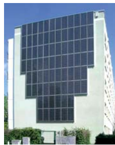
Photovoltaik am Wohngebäude in der Georg-Benjamin-Straße 15

Auch im Ortsteil Buch haben die Themen Energie und Klimaschutz eine immer größere Bedeutung. Gemeinsam mit Akteuren der Energieerzeugung und den größten Energieverbrauchern wie z.B. dem Campus Buch, dem Helios-Klinikum und den Wohnungsunternehmen wird ein energetisches Quartierskonzept für den Ortsteil Buch erarbeitet. Darin werden Festlegungen für energiesparende und klimaschützende Maßnahmen getroffen.