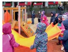
© Foto: Pankow Ameisenspielplatz Theodor-Brugsch-Straße