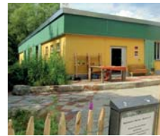
Kinderklub „Der Würfel“ vor und nach der Sanierung