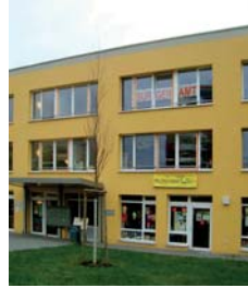
Eingangsbereich Bucher Bürgerhaus

Franz-Schmidt-Straße 8-10 Umbau einer ehemaligen Kita in das Bucher Bürgerhaus mit vielfältigen Beratungsangeboten, dem Bucher Bürgeramt, einem großen Veranstaltungsraum und einem Café mit Garten: ■ Energetische Sanierung ■ aufwändiger Um- und Ausbau ■ Freiflächen- und Gartengestaltung