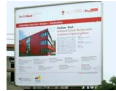
Bauvorbereitung Modularer Schulerweiterungsbau (MEB)