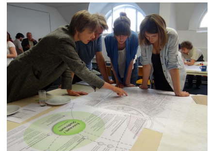
Das Konzept war auch Thema der Internationalen Studentischen Sommerakademie 2012