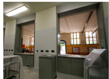
Blick von der Speisenausgabe in die Mensa