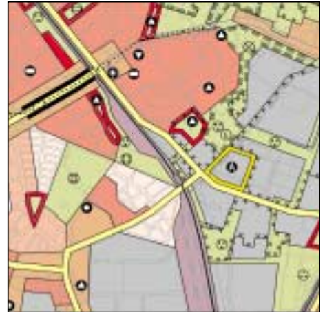
FNP Berlin (Stand Juni 2000) 1:50.000