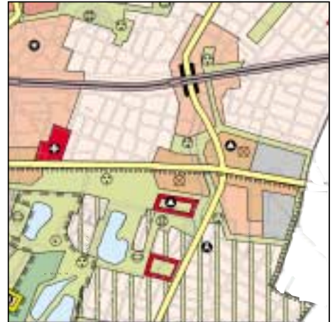
FNP Berlin (Stand Juni 2000) 1:50.000