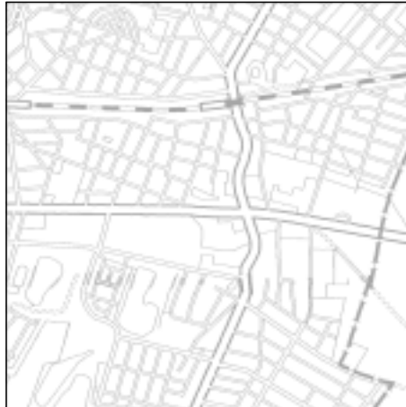
Topographische Karte 1:50.000