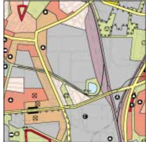
FNP Berlin (Stand Juni 1999) 1:50.000