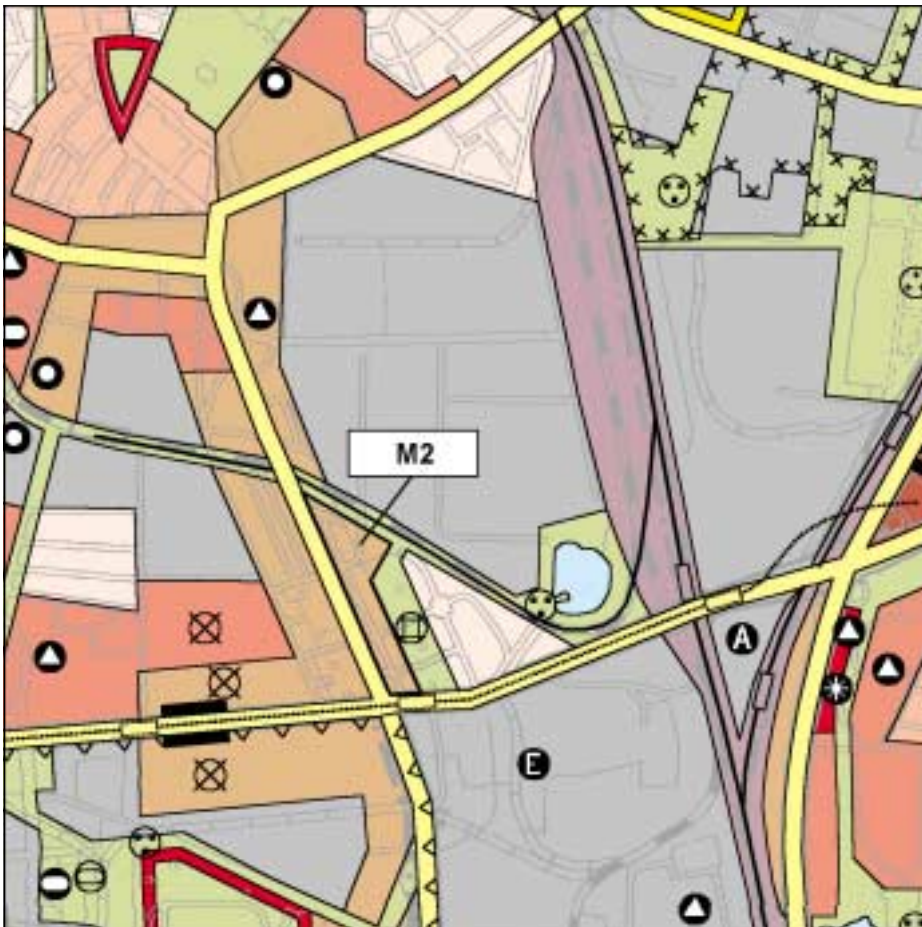
FNP-Änderung (wirksam mit Bekanntmachung im Amtsblatt) 1:25.000

Der Bereich an der Landsberger Allee/Rhinstraße wird aufgrund seiner Lage- und Erschließungsgunst sowie bereits realisierter und geplanter Nutzungen neu bewertet.