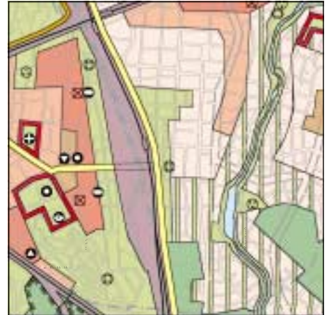
FNP Berlin (Stand Juni 1999) 1:50.000