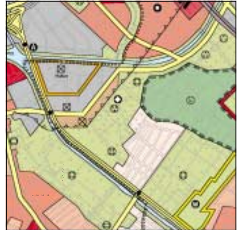
FNP Berlin (Stand Juni 1999) 1:50.000