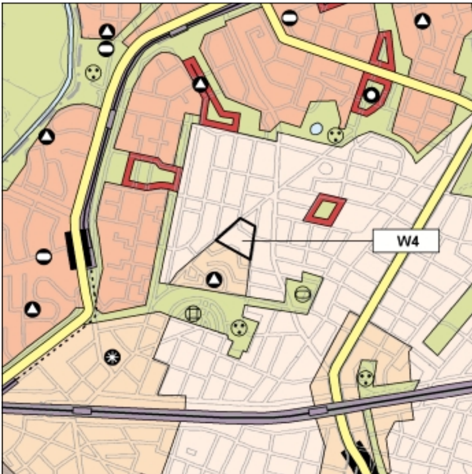
FNP Änderung (wirksam mit Bekanntmachung im Amtsblatt) 1:25.000

Auf den Schulstandort im "Kirchendreieck" kann verzichtet werden, weil die Bedarfe durch die umliegenden Schulen abgedeckt werden.