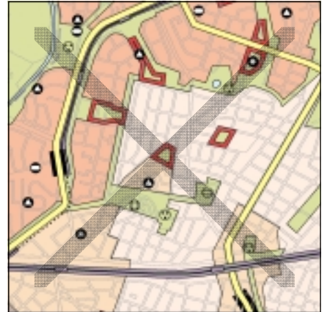
FNP Berlin (Stand Juli 2001) 1:50.000