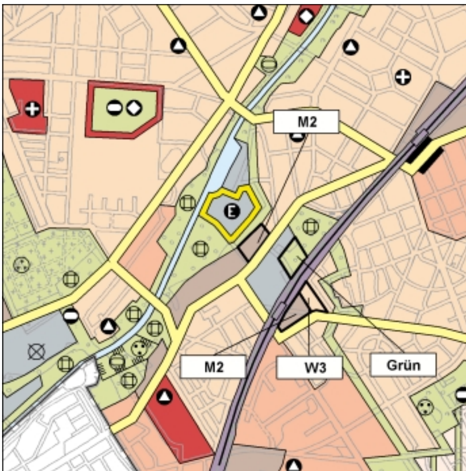
FNP Änderung (wirksam mit Bekanntmachung im Amtsblatt) 1:25.000

Der Ortskern Giesensdorf soll durch Arrondierung und die Mobilisierung von Nutzungspotentialen eine Aufwertung erfahren: