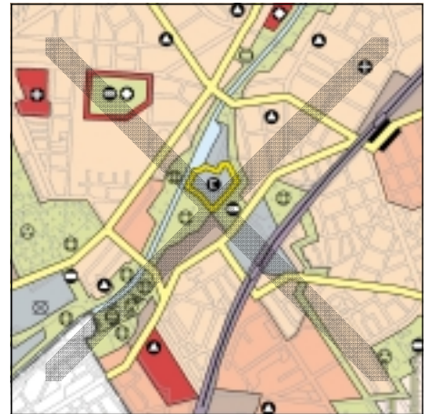
FNP Berlin (Stand Juli 2001) 1:50.000