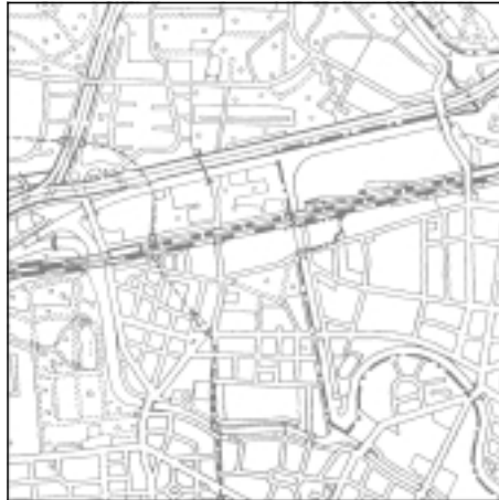
Topographische Karte 1:50.000