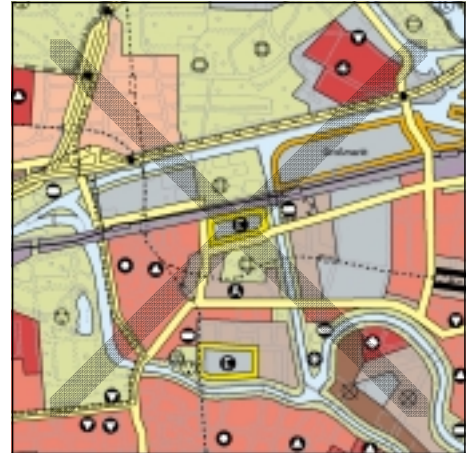
FNP Berlin (Stand Juli 2001) 1:50.000