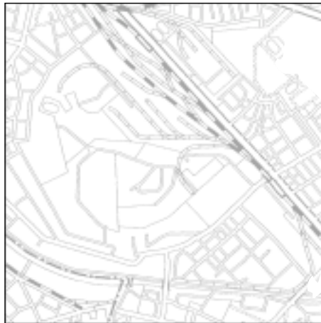
Topographische Karte 1:50.000