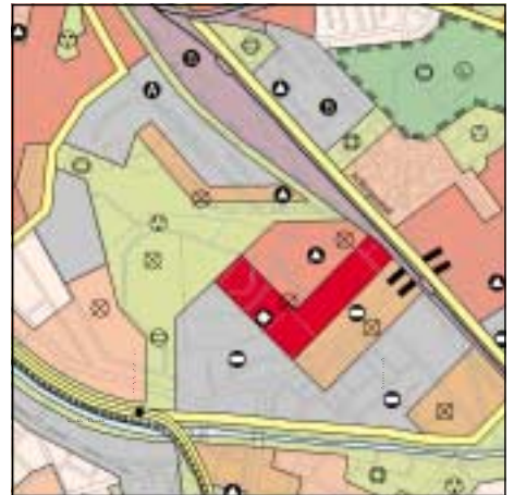
FNP Berlin (Stand Juni 1999) 1:50.000