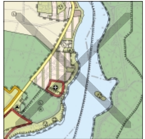
FNP Berlin (Stand Juli 2001) 1:50.000