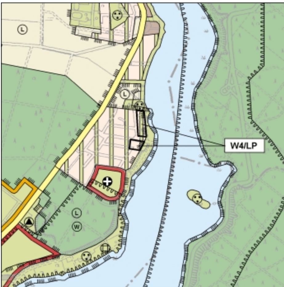
FNP Änderung (wirksam mit Bekanntmachung im Amtsblatt) 1:25.000

Planungsziel ist eine behutsame Bestandsentwicklung dieser schon jetzt durch Wohn- und Wochenendnutzungen geprägten Bereiche. Anstatt Grünfläche wird dementsprechend Wohnbaufläche W4 mit landschaftlicher Prägung dargestellt.