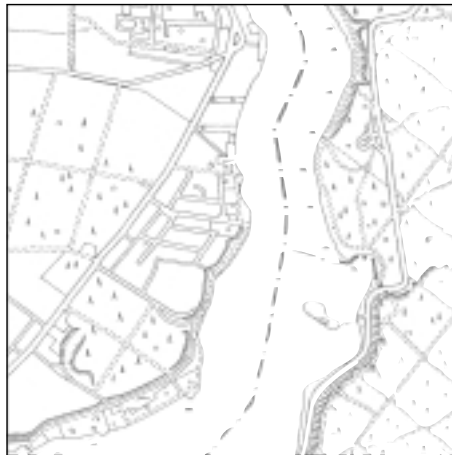
Topographische Karte 1:50.000