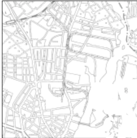
Topographische Karte 1:50.000