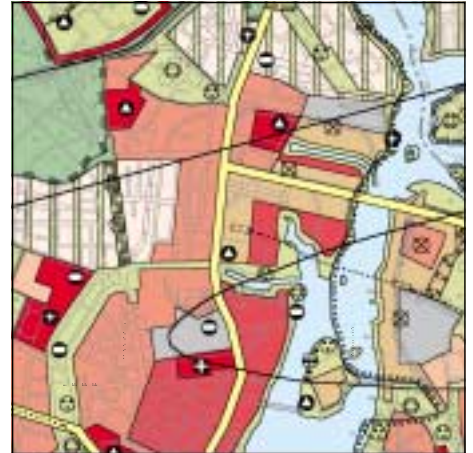
FNP Berlin (Stand Juni 1999) 1:50.000