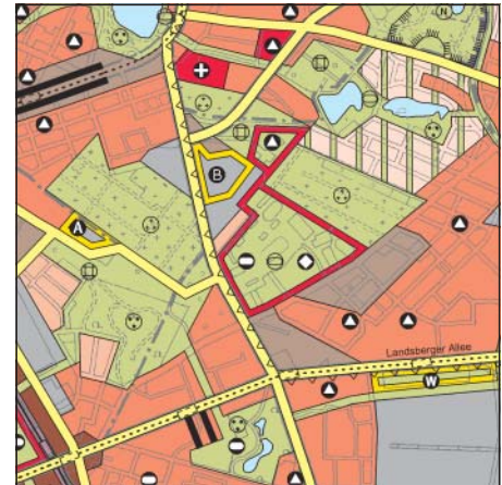
FNP Berlin (Stand Nov. 2002) 1:50.000