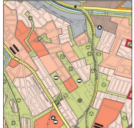
FNP Berlin (Stand Nov. 2002) 1:50.000