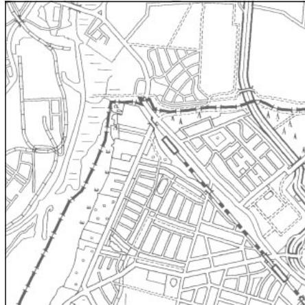
Topographische Karte 1:50.000