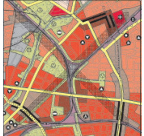
FNP Berlin (Stand März 2002) 1:50.000