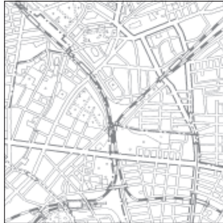
Topographische Karte 1:50.000