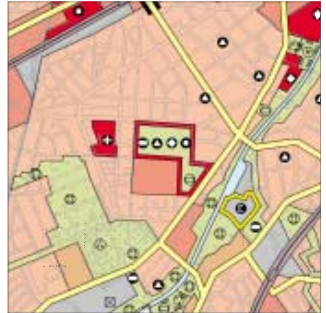
FNP Berlin (Stand Feb. 2001) 1:50.000