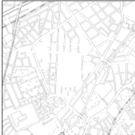
Topographische Karte 1:50.000