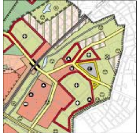
FNP Berlin (Stand Juni 1999) 1:50.000