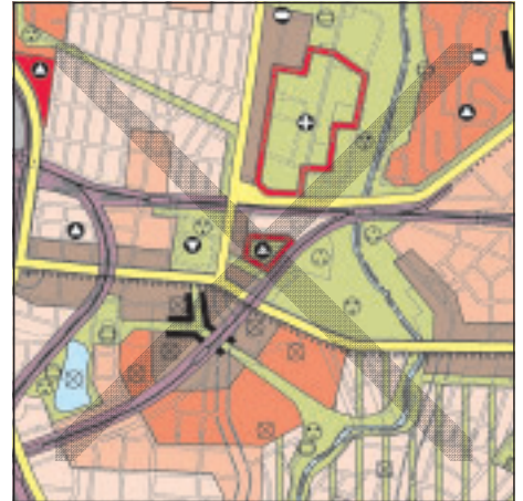
FNP Berlin (Stand März 2002) 1:50.000