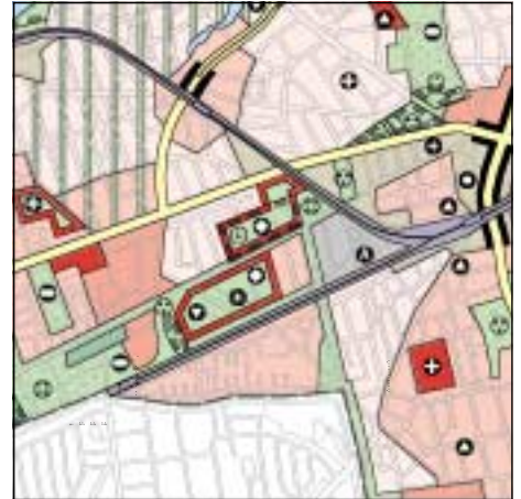
FNP Berlin (Stand Juni 1999) 1:50.000