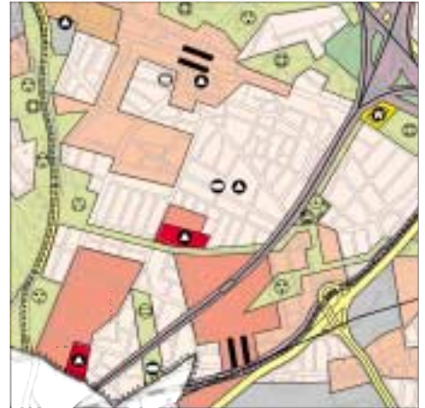
FNP Berlin (Stand Feb. 2001) 1:50.000