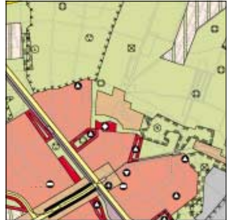
FNP Berlin (Stand Juni 1999) 1:50.000