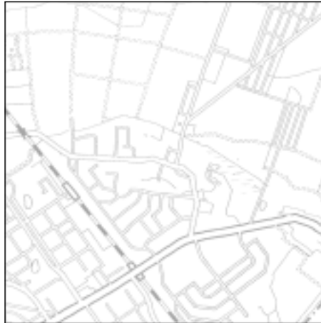
Topographische Karte 1:50.000