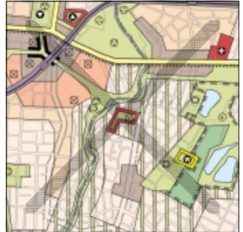
FNP Berlin (Stand Juli 2001) 1:50.000