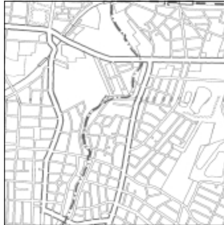
Topographische Karte 1:50.000