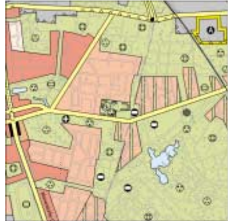
FNP Berlin (Stand Feb. 2001) 1:50.000