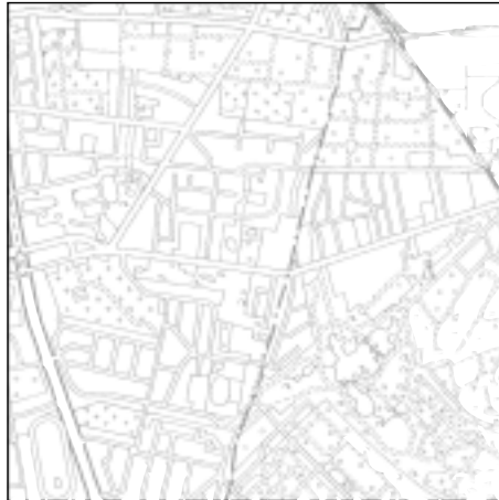
Topographische Karte 1:50.000