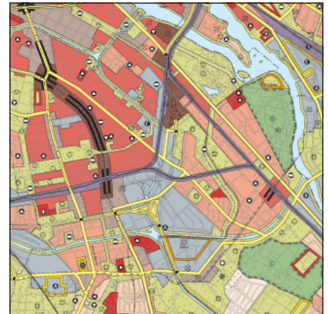
FNP Berlin (Stand März 2002) 1:100.000