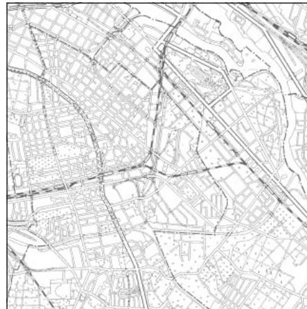
Topographische Karte 1:100.000