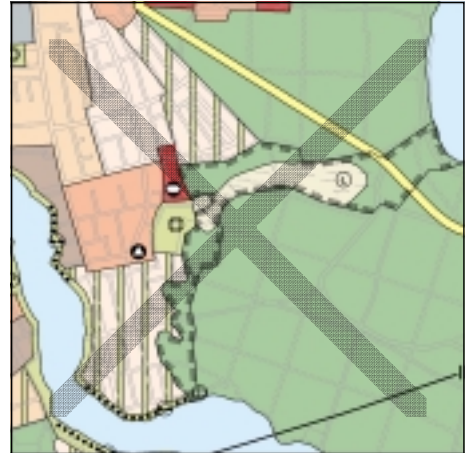
FNP Berlin (Stand Juli 2001) 1:50.000