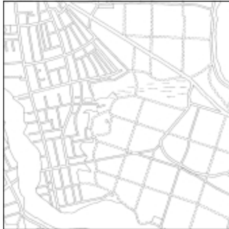
Topographische Karte 1:50.000