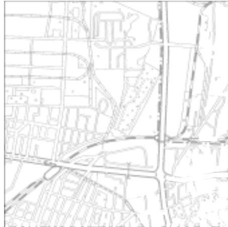
Topographische Karte 1:50.000