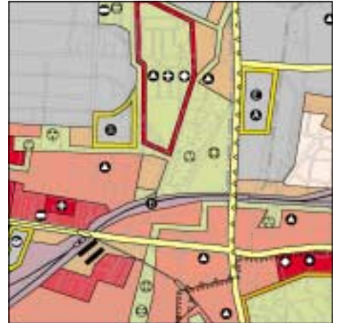
FNP Berlin (Stand Okt. 1998) 1:50.000