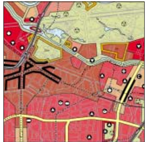
FNP Berlin (Stand Juni 2000) 1:50.000