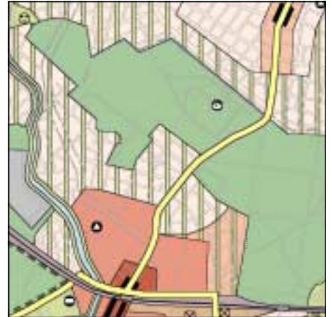
FNP Berlin (Stand Juni 1999) 1:50.000