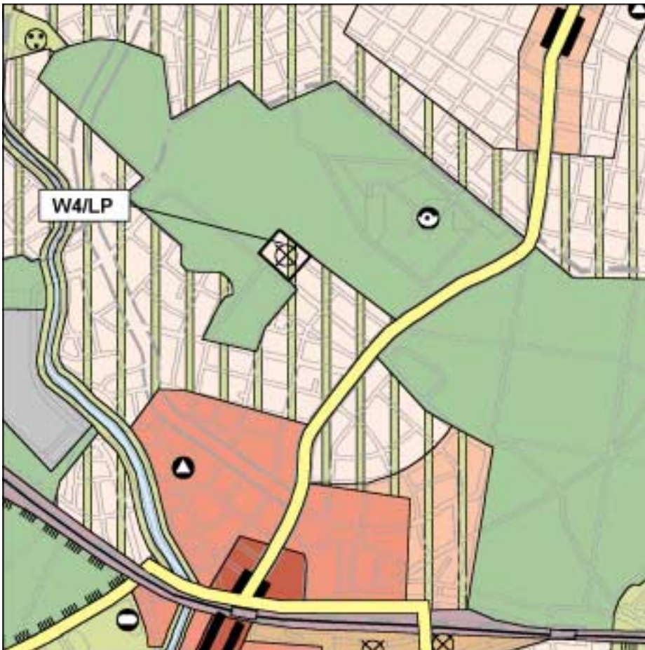
FNP-Änderung (wirksam mit Bekanntmachung im Amtsblatt) 1:25.000

Die Darstellungen des FNP werden im Bereich der Straße Unter den Birken überarbeitet. Ziel ist die städtebauliche Neuordnung dieser versiegelten und z.T. gewerblich genutzten Fläche, wobei die Entwicklung zu einer Wohnbaufläche mit geringer baulicher Dichte eine Verbesserung der ökologischen Situation des gesamten Bereichs ermöglicht.