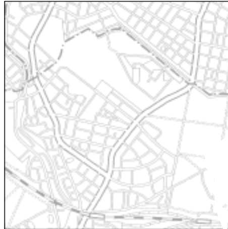
Topographische Karte 1:50.000