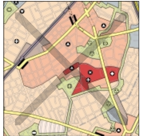
FNP Berlin (Stand Juli 2001) 1:50.000