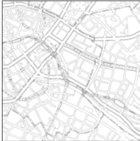
Topographische Karte 1:50.000