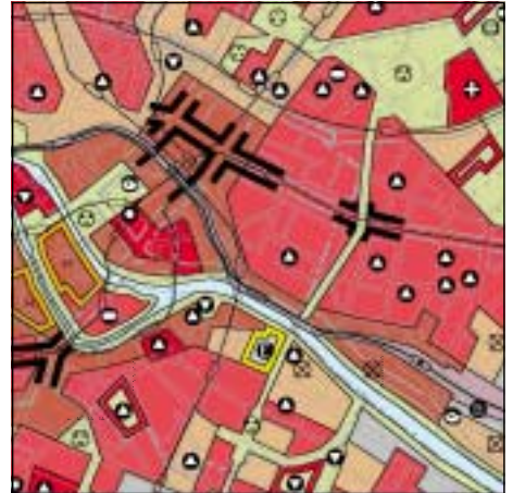
FNP Berlin (Stand Juni 1999) 1:50.000