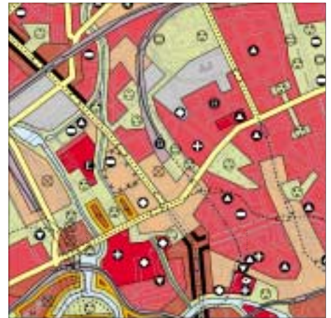
FNP Berlin (Stand Feb. 2001) 1:50.000