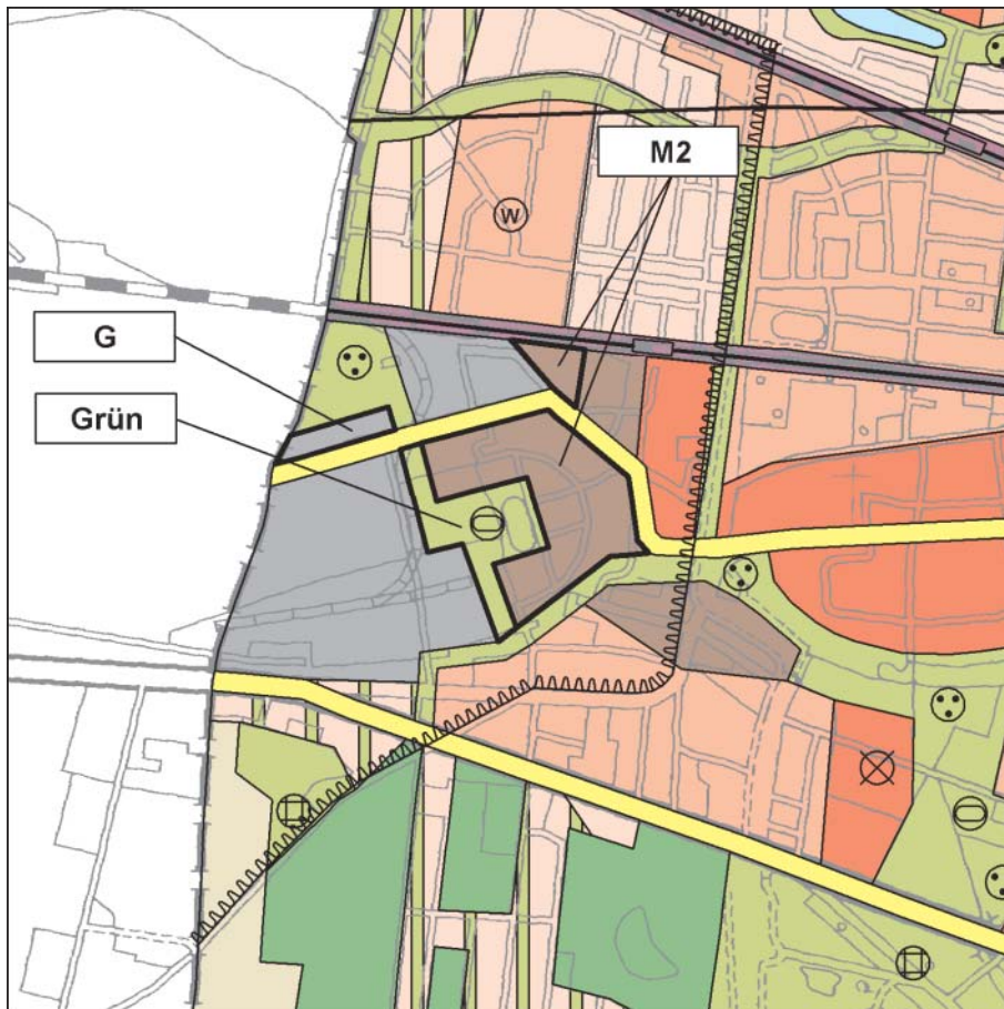
FNP Änderung (wirksam mit Bekanntmachung im Amtsblatt) 1:25.000

Ausgehend von veränderten teilträumlichen Planungszielen für das ehem. Flugplatzareal, die mit der Gemeinde Dallgow-Döberitz abgestimmt wurden, soll die Gewerbe- und Freiraumentwicklung planerisch verändert werden.