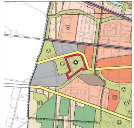
FNP Berlin (Stand Nov. 2002) 1:50.000