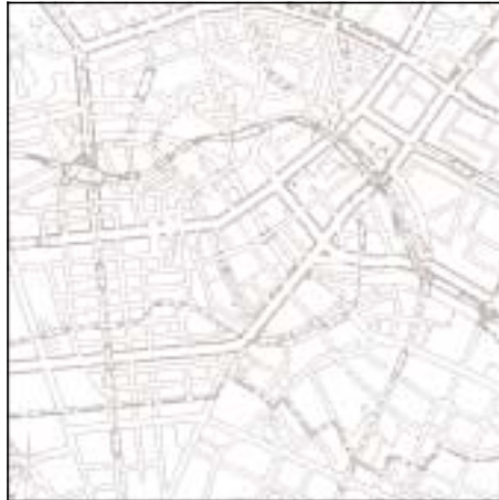
Topographische Karte 1:50.000