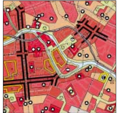
FNP Berlin (Stand Okt. 2000) 1:50.000