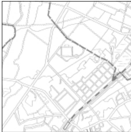
Topographische Karte 1:50.000