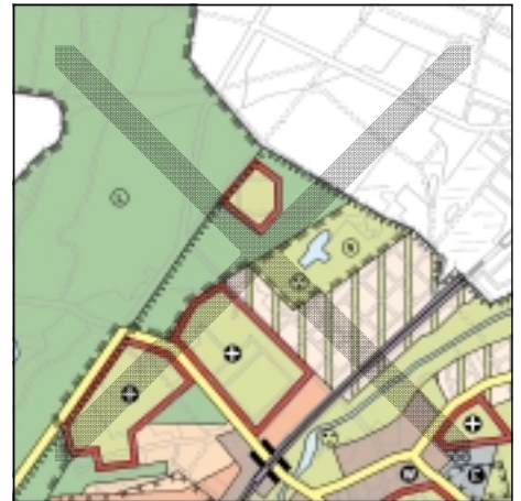
FNP Berlin (Stand Juli 2001) 1:50.000