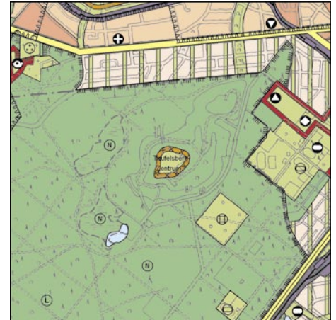
FNP Berlin (Stand April 2005) 1:50.000