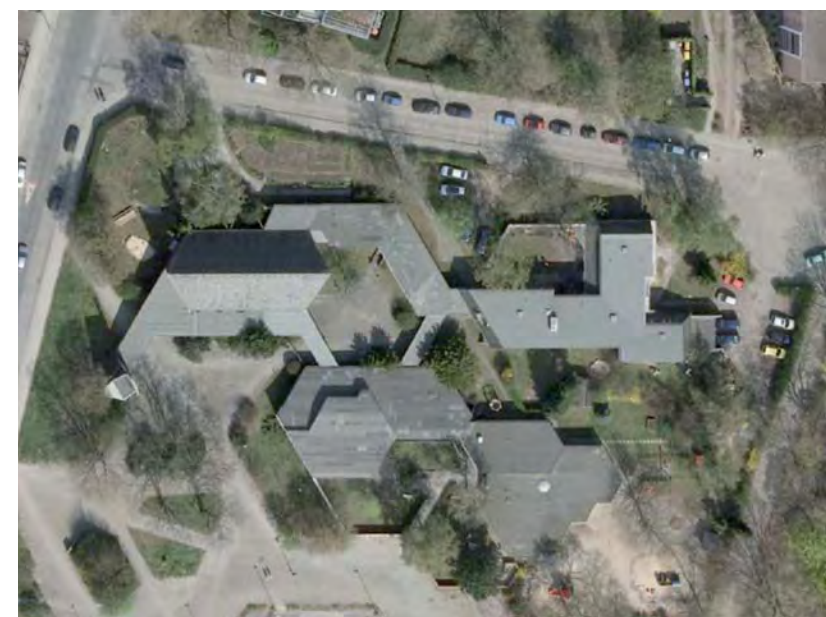
Planung: Bergander Landschaftsarchitekten