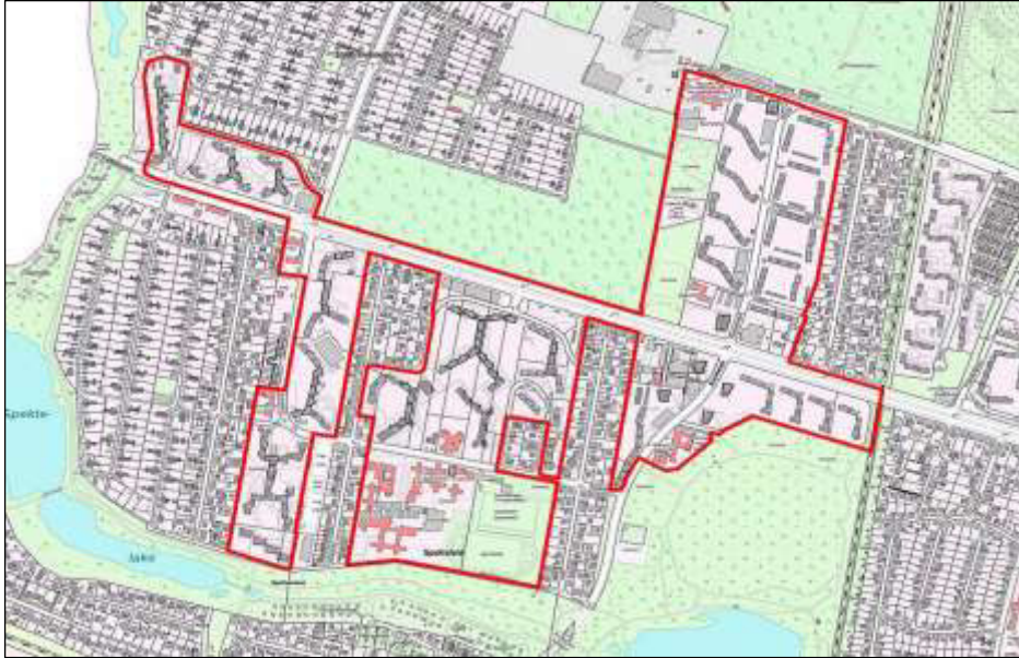
Gebietskarte Quartiersmanagementgebiet Falkenhagener Feld West 14