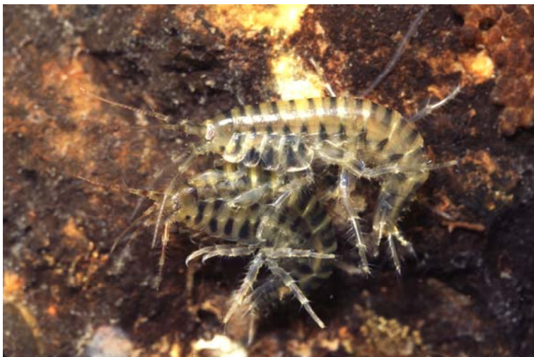
G. tigrinus

Gammarus tigrinus gelangte wahrscheinlich mit Bilge- oder Ballastwasser in den 1930er Jahren von der nordamerikanischen Westküste nach Großbritannien. 1957 wurden ca. 1.000 Exemplare aufgrund der Salzverträglichkeit der Art in die versalzte Werra und 1976 in die Elbe ausgesetzt (SCHMITZ 1960, EGGERS & MARTENS 2001). Derzeit wird die Art in vielen Gewässern von Dikerogammarus villosus verdrängt (DICK & PLATVOET 2000, EGGERS & MARTENS 2001).