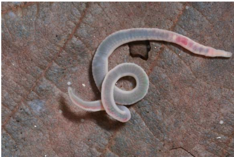
B. sowerbyi

Bei Branchiura sowerbyi handelt es sich um eine wärmeliebende Neozoe aus Südostasien. Die detritusfressende Tubificide wurde durch Schiffe eingeschleppt und konnte in Europa erstmals in erwärmten Wasserbassins in Hamburg und London nachgewiesen werden (TOBIAS 1972).