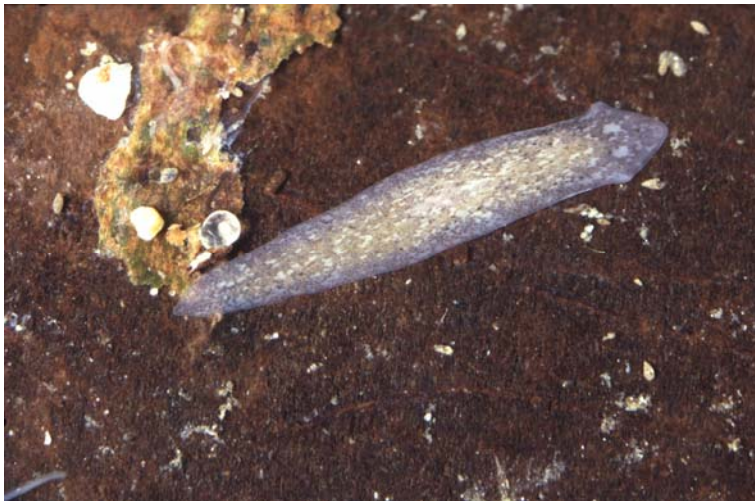
D. tigrina

Dugesia tigrina wurde Anfang des 20. Jahrhunderts mit Aquarienpflanzen nach Europa eingeschleppt und konnte sich hier schnell verbreiten. Heute ist der Gefleckte Strudelwurm in ganz Mitteleuropa sowie in Italien, Spanien und Russland zu finden. In den deutschen Bundeswasserstrassen ist er weit verbreitet, erreicht jedoch häufig nur geringe Populationsdichten.