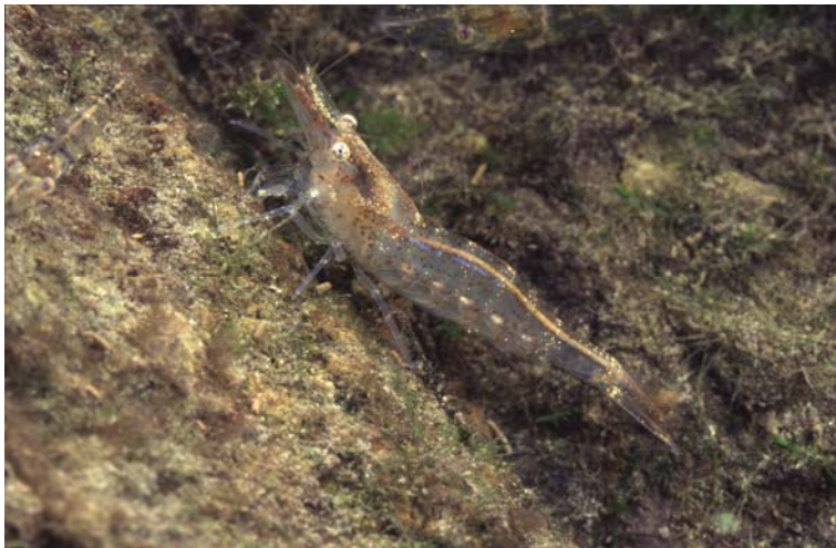
A. desmaresti

Die ca. 20 mm lange Süßwassergarnele Atyaephyra desmaresti gehört zur Gruppe der „postglazialen Remigranten“ (GLAUCHE & KRATZ 2003) und drang vom Mittelmeerraum vorzugsweise über Schifffahrtswege wieder nach Westeuropa vor. Ihre Verbreitung erfolgte in erster Linie durch aktive Wanderung, die durch den Ausbau der Wasserstrassen und das europäische Kanalnetz begünstigt wurde (REY et al. 2004). So wurde die Art 1843 in Paris, 1888 in Belgien und 1916 in den Niederlanden festgestellt (THIENEMANN 1950). Der erste Fund in Deutschland erfolgte 1932 in einem Altarm am Niederrhein, 1959 wurde die Garnele erstmalig in der Berliner Havel im Bereich der Pfaueninsel nachgewiesen (BORCHERT & JUNG 1960).