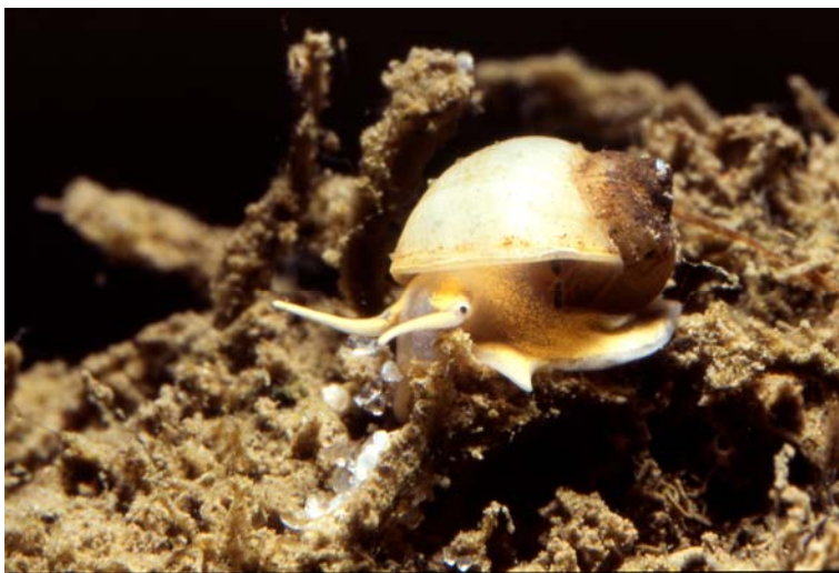
L. naticoides

Der max. 8 mm große Flussteinkleber besiedelte noch vor der letzten Eiszeit weite Teile Deutschlands, seine nördliche Verbreitungsgrenze lag ungefähr in der Höhe von Berlin (THIENEMANN 1950). Während der Weichseleiszeit wurde er dann bis in das Donaugebiet zurückgedrängt. Bereits im 19. Jahrhundert wanderte Lithoglyphus naticoides dann aus zwei Richtungen, von Osten aus dem Dnjepr-Gebiet und von Süden von der Donau, über Flüsse und Kanäle in weite Teile Deutschlands wieder ein (THIENEMANN 1950, GLÖER 2002). Bis zum Ende der 1950er Jahre war die sauerstoffbedürftige Art in Deutschland allgemein verbreitet, danach war die Entwicklung der Bestände vermutlich aufgrund der zunehmenden Gewässerverschmutzung rückläufig (TITZNER et al. 2000).