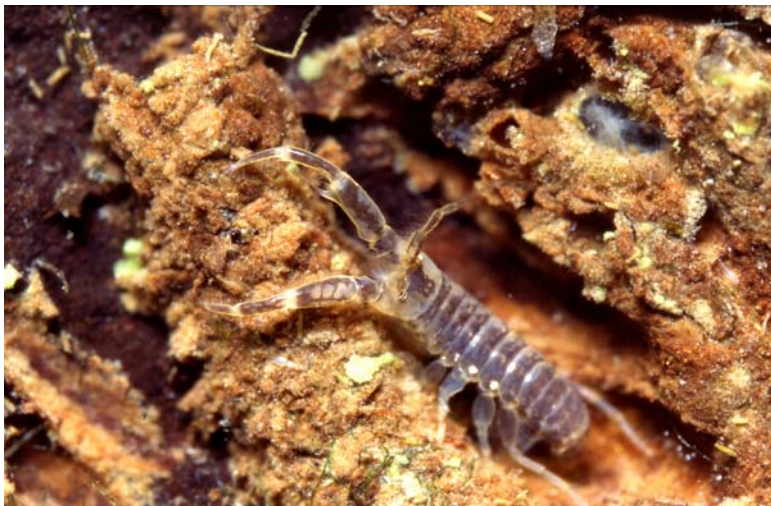
C. curvispinum

Der bis zu 9 mm große Chelicorophium curvispinum erreichte Norddeutschland über die Flüsse Dnjepr, Pripet, Weichsel und Warthe und wurde in Deutschland erstmalig 1912 im Müggelsee (Berlin) gefunden. Eine zweite Einwanderungswelle erfolgte wesentlich später über die Donau (EGGERS & MARTENS 2001). Inzwischen hat sich die Art in ganz Mitteleuropa und in allen Bundeswasserstraßen ausgebreitet, wo der aktive Filtrierer die Steinschüttung mit seinen Wohnröhren überdeckt. Während er in Kanälen üblicherweise nur in vergleichsweise geringer Dichte vorkommt, konnte er sich seit Mitte der 1980er Jahre in den Flüssen explosionsartig vermehren und erreichte Abundanzen bis zu 750.000 Individuen/m 2 . In den letzten Jahren befindet sich die Art in vielen Gewässern im Rückgang, vermutlich hauptsächlich aufgrund des Auftretens des ebenfalls neozoischen räuberischen Flohkrebbses Dikerogammarus villosus (TITTIZER et al. 2000). An der Elbe konnte sie sich in den letzten Jahren jedoch wieder verstärkt ausbreiten (KRIEG 2002).