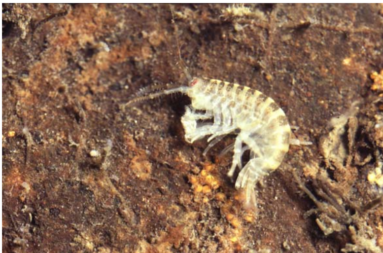
D. villosus

Dikerogammarus villosus wurde 1991 erstmalig in der deutschen Donau festgestellt (WEINZIERL et al. 1996), 1994 im Rhein und 1998 in der Elbe und angrenzenden Kanälen. In der Unterhavel wurde die Art von RUDOLPH (2000) erstmalig 1999 beobachtet, mittlerweile ist sie bis zur Oder vorgedrungen. Große Individuen (max. 21 mm) besiedeln gerne die Steinschüttung, wo sie sich mit abgespreizten Peraeopoden verkeilen.