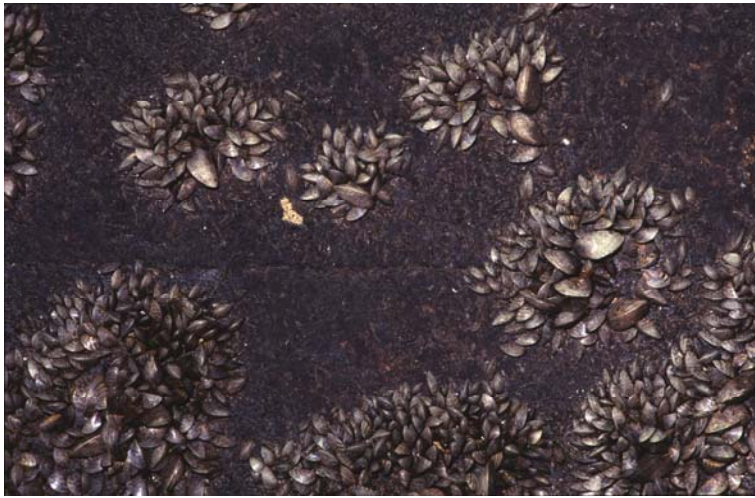
Aufwuchs von D. polymorpha

Unbeweglichkeit der Muschel mit entsprechend hohen Verlusten beim Trockenfallen (REICHHOLF 1996) diskutiert.