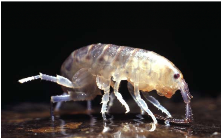
O. cavimana

Der Süßwasserstrandfloh lebt semiterrestrisch im feuchten Uferbereich. Am Tage verbirgt sich die nachtaktive Art unter Steinen und Treibgut. Wird sie aufgeschreckt, so zeigt sie ein auffälliges Sprungverhalten (Name!).