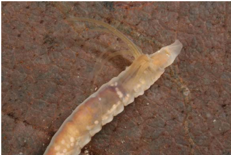
H. invalida

Der einzige Süßwasserpolychaet in Mitteleuropa stammt aus dem pontokaspischen Raum und stellt - wie die Dreikant- und Körbchenmuscheln - ein Relikt der tertiären Meeresfauna dar. Er kommt heute vor allem in den Gewässern der Balkanhalbinsel, aber auch in den Süßwasser- und Brackwasserabschnitten der Donau vor (REY et al. 2004).