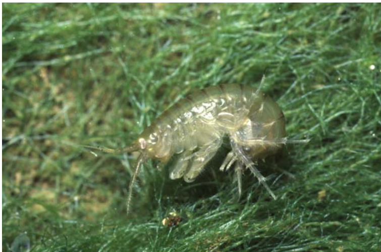
P. robustoides

Pontogammarus robustoides wurde in Deutschland erstmalig 1991 in der Oder und 1994 in der Peenemündung nachgewiesen. Danach breitete er sich vermutlich über den Oder-Havel-Kanal und den Elbe-Havel-Kanal in Richtung Westen aus und trat 1998 auch im Mittellandkanal bis nach Niedersachsen auf.