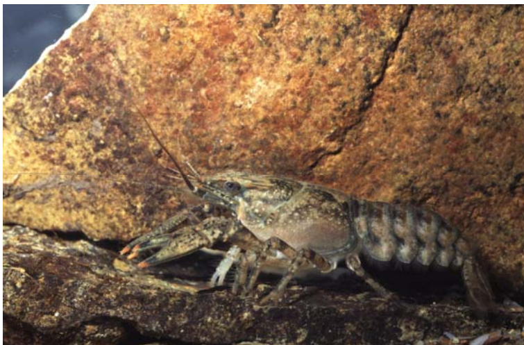
O. limosus

Zum Ende des 19. Jahrhunderts kam es zu einem starken Bestandsrückgangs der ehemals weit verbreiteten und häufigen einheimischen Edelkrebse ( Astacus astacus ). Der Grund lag in einem zunehmenden Befall mit dem Pilz Aphanomyces astaci (Krebspest). Zur Kompensation der Bestandsrückgänge wurden 1880 ca. 100 Exemplare der gegen die Krebspest widerstandsfähigen Flusskrebsart Orconectes limosus aus dem Osten der Vereinigten Staaten (Pennsylvania) nach Deutschland eingeführt und in einer Teichanlage in der Neumark ausgesetzt (ALT 1951, zit. bei TITTIZER et al. 2000, THIENEMANN 1950). Diese Teichanlage war über das Flüsschen Mietzel mit dem Odersystem verbunden. In den Folgejahren kam es europaweit noch zu weiteren Aussetzungen, noch in den 1890er Jahren auch in die Havel bei Potsdam (RUDOLPH 2000). Der resistente Amerikanische Flusskrebs übertrug die Krebspest auf die einheimischen Flusskrebsarten und trug so zu deren weiterer Dezimierung bei.