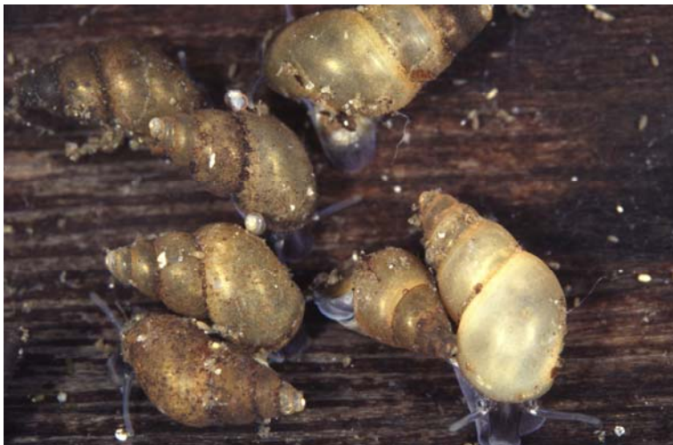
P. antipodarum

Die mit max. 6 mm Höhe recht kleine Wasserschnecke Potamopyrgus antipodarum wurde vermutlich mit dem Ballastwasser der Schiffe (ZETTLER et al. 2006) bereits um 1839 nach Europa eingeschleppt (JAECKEL 1962). Die Art verbreitete sich zunächst in England, war aber auch schon 1887 an der Ostseeküste bei der Insel Poel zu finden. Inzwischen hat sie sich in ganz Deutschland ausgebreitet.